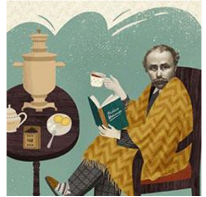
Фото з книги «Видавництва Старого Лева» «Шевченко від А до Я»

1. Уявіть, що Вас запрошено на вечерю з Т. Шевченком. Про що б Ви запитали в поета й чому? Ваші думки викладіть у формі розповіді.