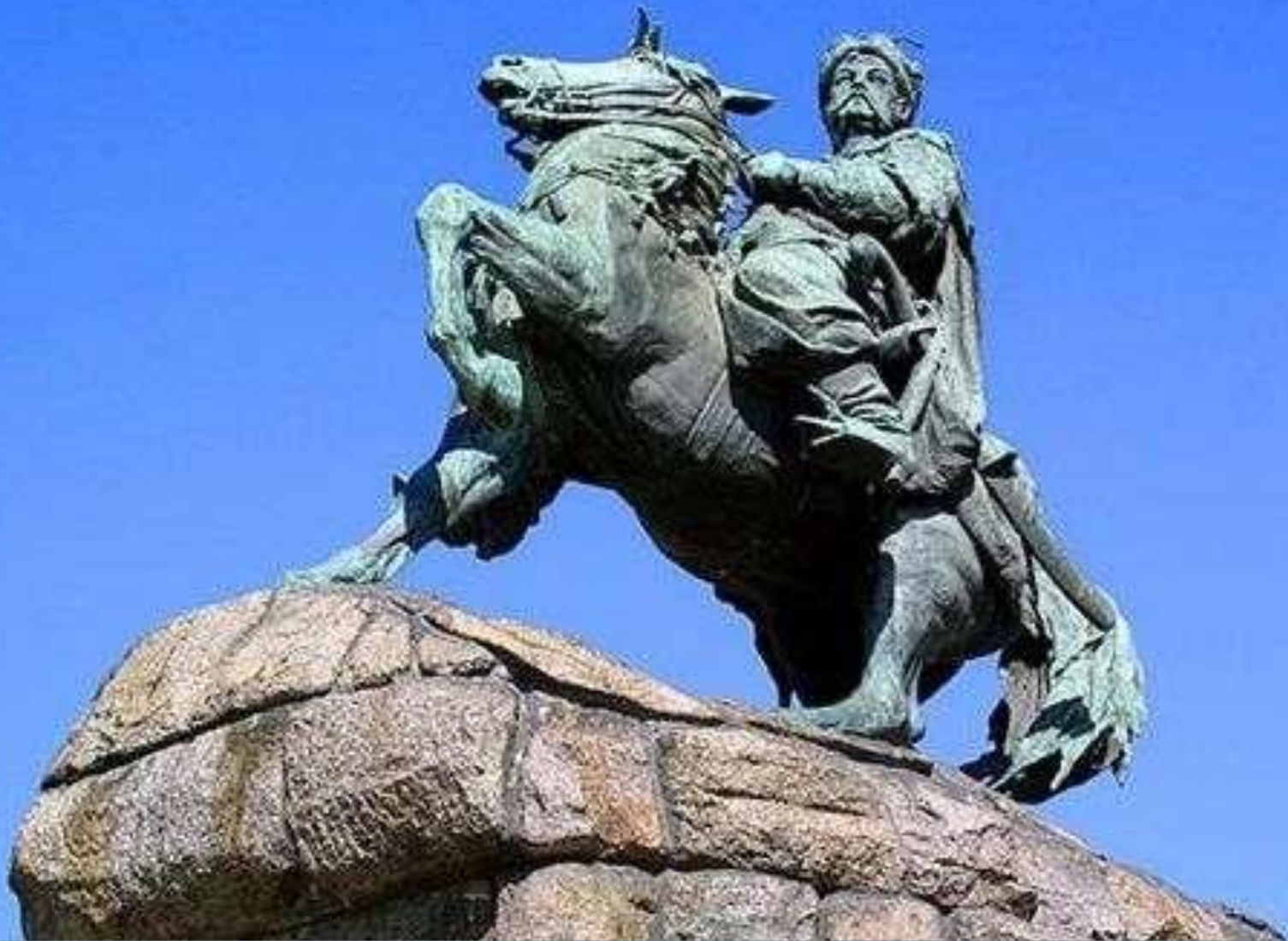
Monument to Bohdan Khmelnytsky