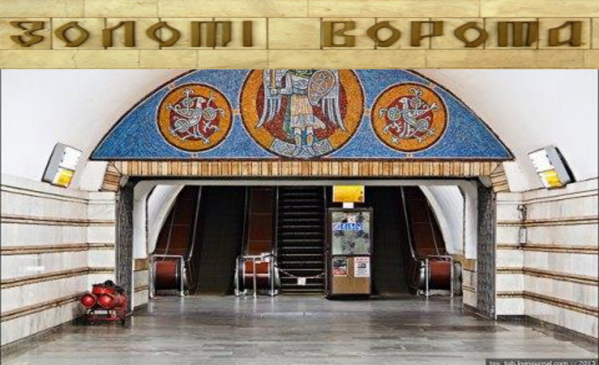
Golden Gate Metro Station