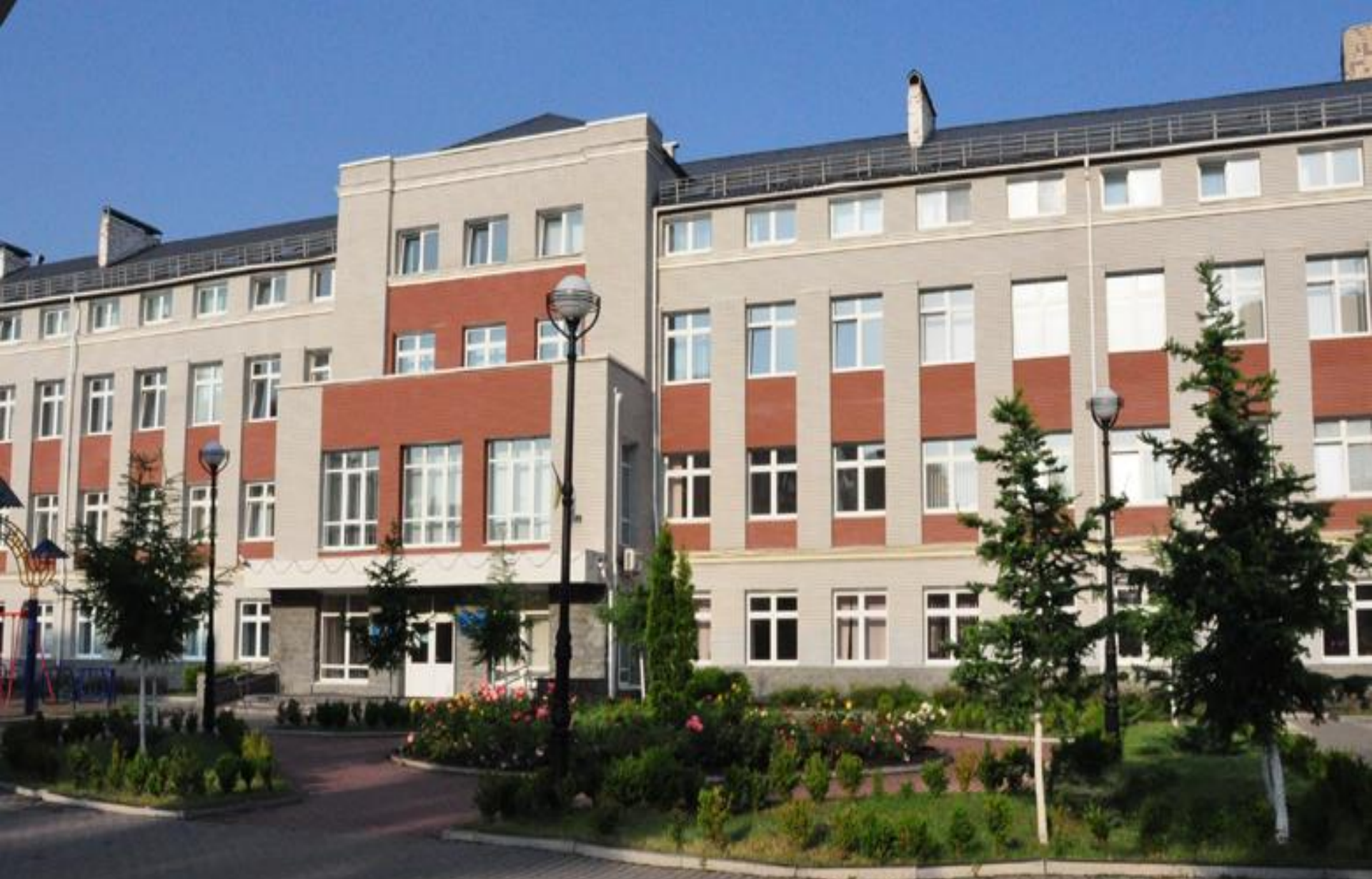
Kyiv specialized school 115 named after Ivan Ohiyenko