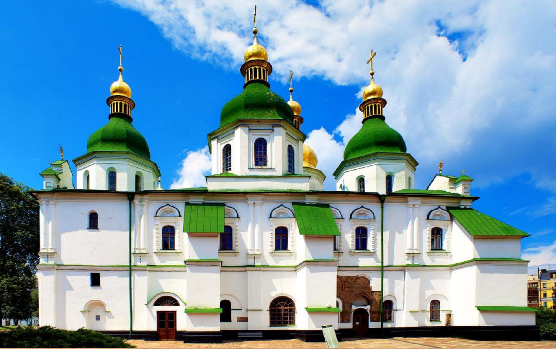
Saint Sophia's Cathedral