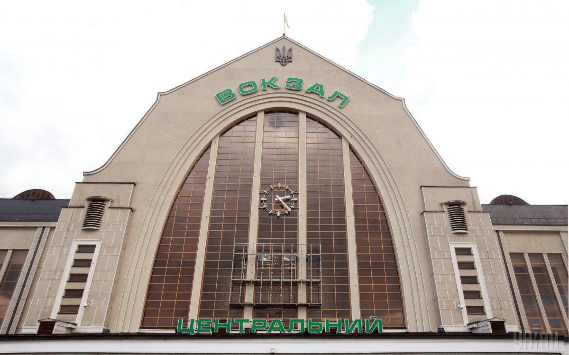
The Kyiv Railway Terminal