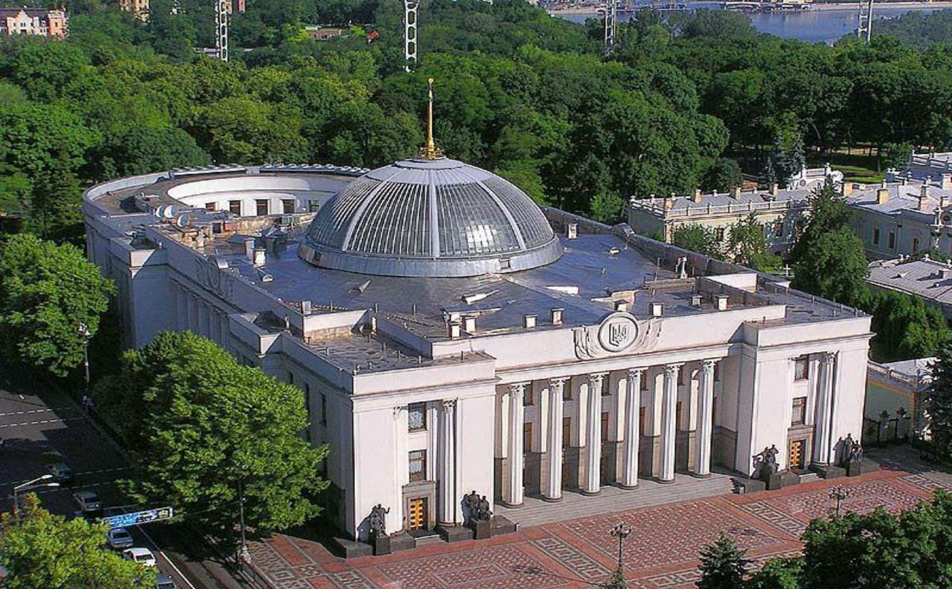
The Verkhovna Rada of Ukraine