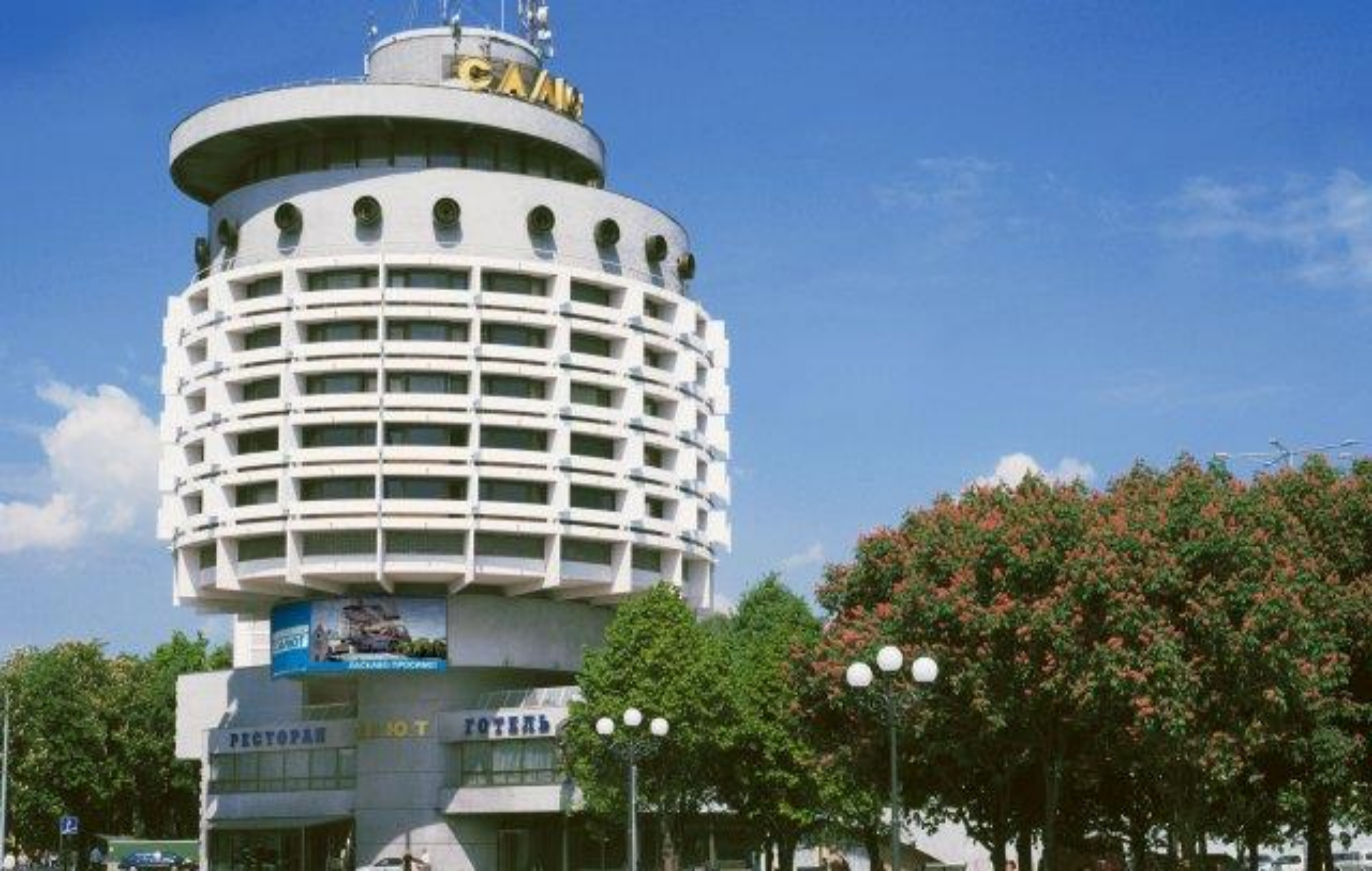
The Saliut Hotel